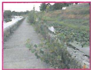
Nénuphars et jussie dans le canal