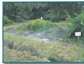
Renouée asiatique à Combleux